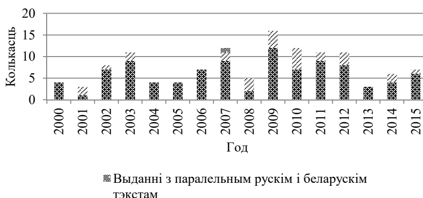
Малюнак 1. Размеркаванне перакладных выданняў па гадах

Як бачна з дыяграмы, выданні з беларускамоўнымі перакладамі з’яўляліся штогод на працягу аналізаванага перыяду, з рускамоўнымі выходзілі ў 11 гадах з 16, прычым выданні з рускамоўнымі перакладамі “дамінавалі” толькі ў двух гадах: 2001 (1 беларуска-, 2 рускамоўныя выданні) і 2008 (2 беларуска-, 3 рускамоўныя выданні). Аднак у цэлым бачна, што беларускія выдавецтвы аддаюць перавагу беларускім перакладам польскамоўных твораў. Калі паглядзець на “экстрэумы”, то менш за ўсё перакладаў з польскай выйшла ў 2001 і 2013 гг. (па